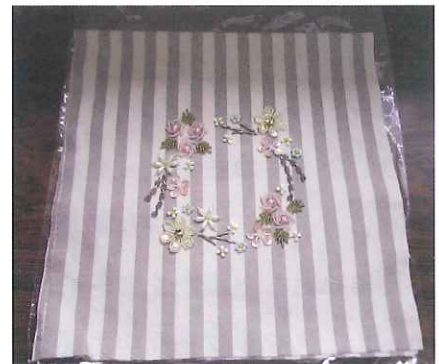
利用者の方が作ったビーズ作品