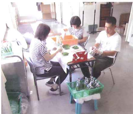
オクラなどの袋入れ作業

これまでの菓子箱折り作業、手袋成型袋詰め作業に加え、割り箸袋入れ作業、オクラなどの袋入れ作業、そして空き缶回収作業を始めました。