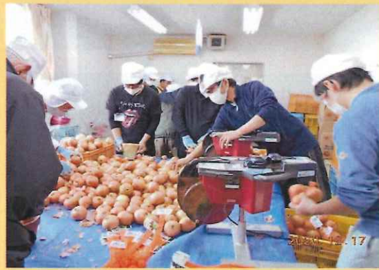
玉ねぎ袋入れ作業 1