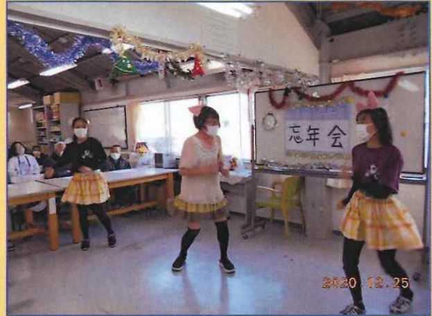
俺の踊りも決まっちゃうやろー！