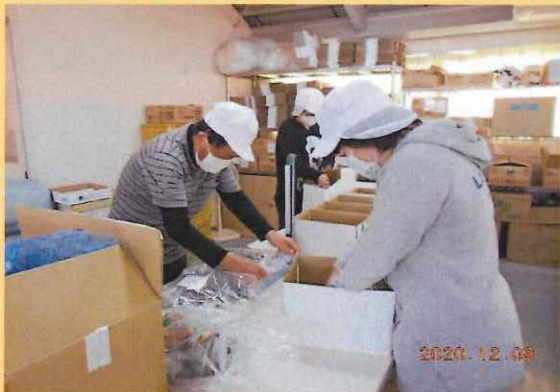
カツオのたたき袋入れ作業