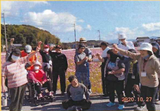
生活介護戸外活動 (コスモス畑散策)