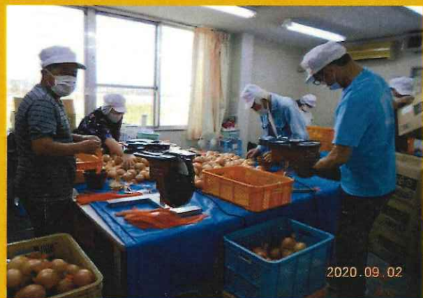
玉ねぎ袋入れ作業(就労B)