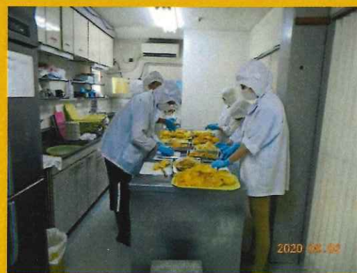
ゆず皮のトリミング(就労B)

ゆずのトリミング作業も7月以降、今日の目標を掲げ、着実に生産量がアップしてきています。